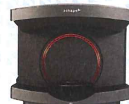
KATANA® Dental Scanner E4